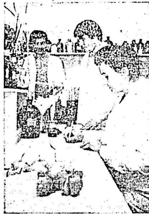
În sectorul de cercetare al S.C.P.P. Lipova se lucrează la obținerea unor soluri noi de pomi fructiferi, cu înalt potențial productiv.