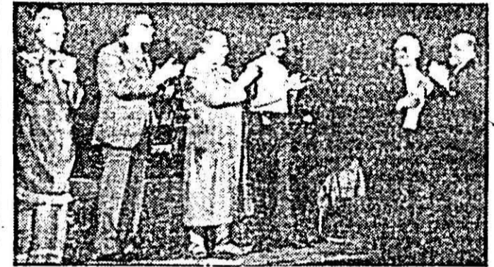
Flori și aplauze pentru realizatorii spectacolului.