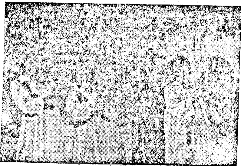
Strângerea recoltelor de struguri într-un colhoz din Tadjikistan. Livezile și viile republicii se întind pe o suprafață de 10.000 hectare

Toate vitele bune de muncă, să fie scoase la câmp.