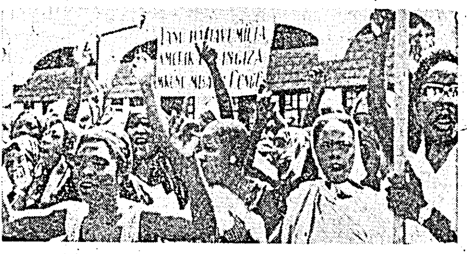
TANZANIA. — Aspect din timpul unei recente demonstrații antiimperialiste care a avut loc la Dar-Es-Salaam.