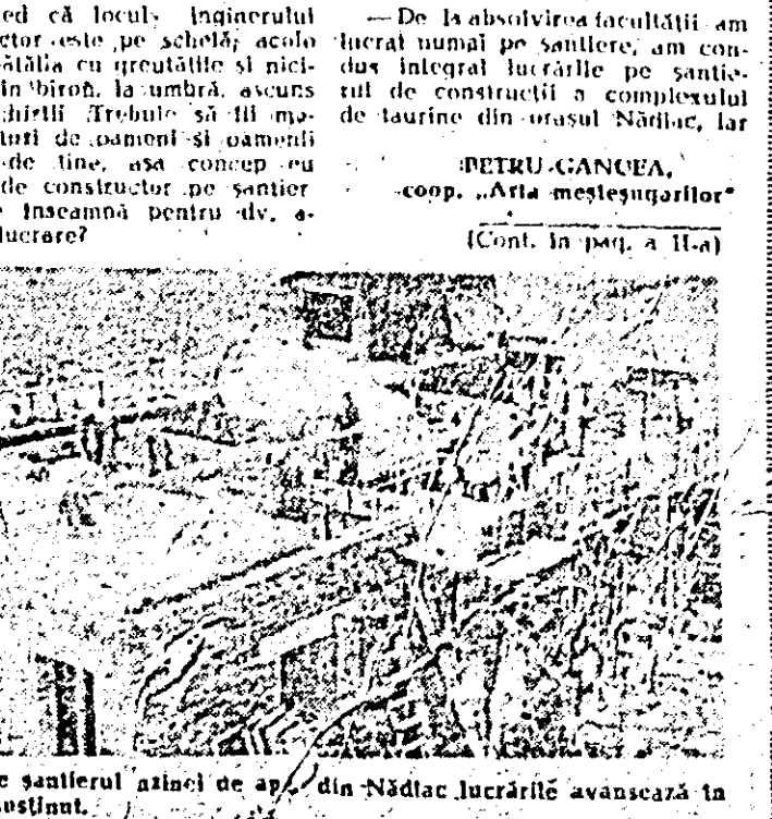
Pe șantierul zănel de ap. din Nădlac lucrările avansează în ritm susținut.