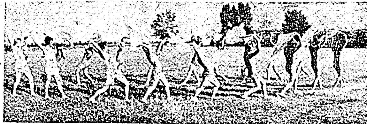
Exerciții de gimnastică pe stadionul Nădlacului.

La bazinul Dinamo din Capitală au început ieri întrecerile