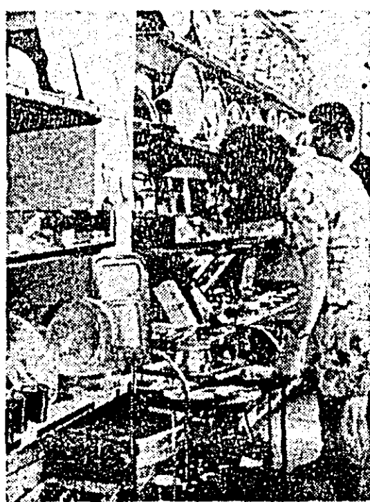
Aspect din magazinul de menaj situat la parterul blocului R, din Piața Vasile Roaia.