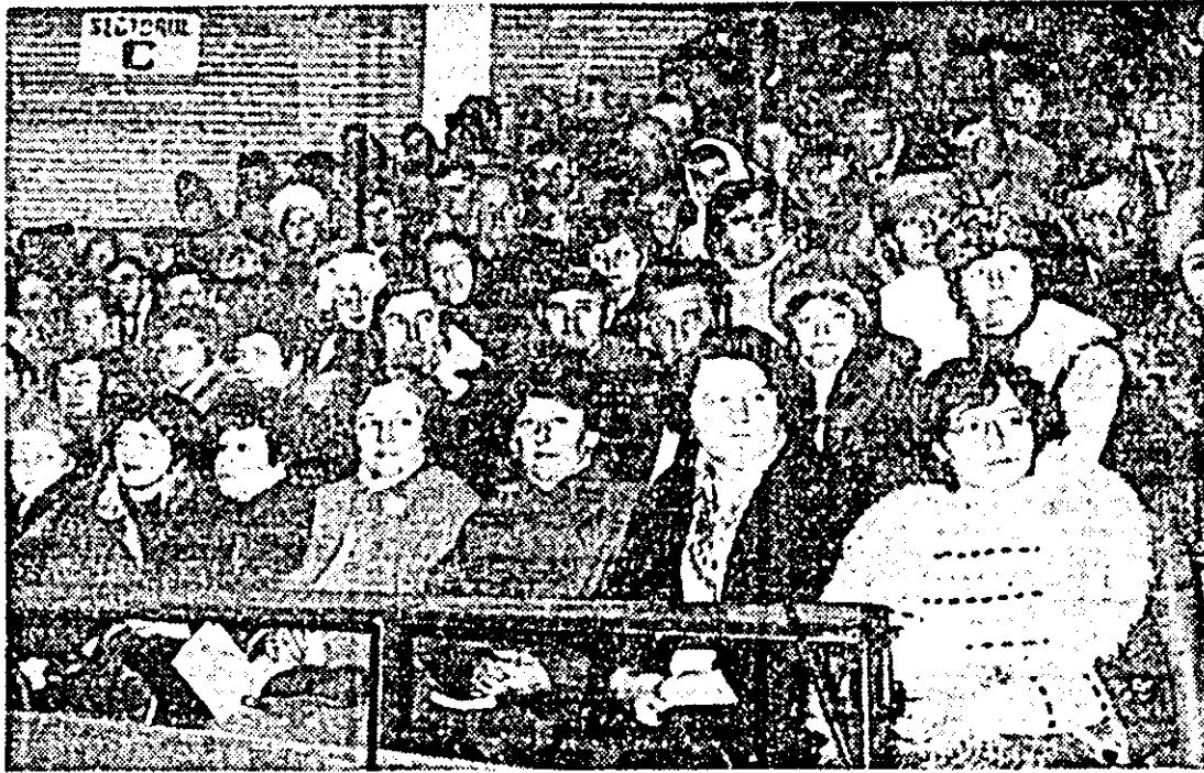
Aspect din sală în timpul desfășurării lucrărilor Conferinței județene a deputaților consiliilor populare.

Într-o atmosferă de puternic și vibrant patriotism, de deosebită satisfacție și recunoștință, participanții la Conferința județeană a deputaților consiliilor populare municipal, orașenești și comunale din județul Arad au adresat, în încheierea lucrărilor conferinței, o telegramă Comitetului Central al Partidului Comunist Român, tovarășului Nicolae Ceaușescu, secretar general al partidului, președintele Republicii Socialiste România.