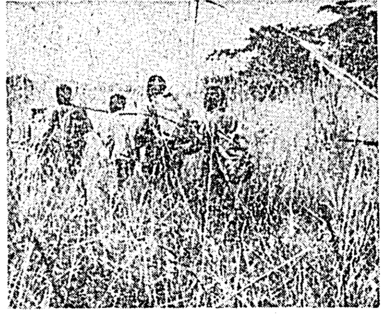
Forțe răscolite ale Congo-ului în timpul unui marș prin junglă.

KAMPALA 18 (Agerpres). Frontiera dintre Uganda și Congo cu capitala la Leopoldville a fost violată în două rânduri, marș și miercuri, de patru congoleze, care au pătruns în regiunea Ruwenzori, în sud-vestul Ugandei, a declarat la 17 februarie Felix Onama, ministrul de interne al Ugandei.