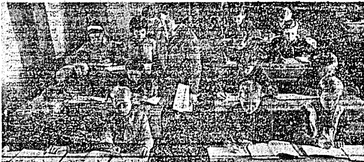
În noua școală cu 4 săli de clasă, elevii au create cele mai bune condiții de învățatură.

Aici funcționează un dispensar dotat cu toate cele necesare, unde un personal calificat acordă asistență medicală tuturor cetățenilor, copiii începînd cu noii născuți și terminînd cu cei de vîrstă școlară. Pentru îmbunătățirea sănătății sanitare, anul trecut s-a deschis un punct farmaceutic de gradul I, deservit de o asistentă farmaceutică, care pune la dispoziția cetățenilor cele mai felurite medicamente.