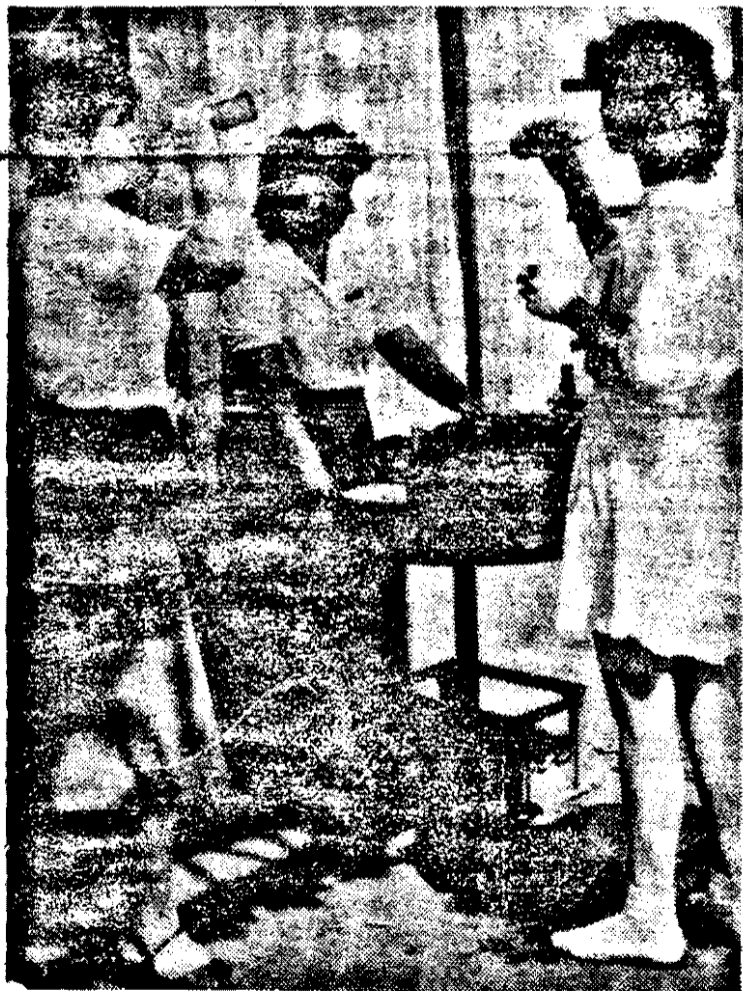
Cine a zis că nu se mai fabrică Pepsi Cola?