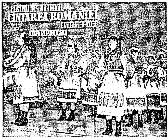
„Surețelul” — un frumos obicei popular prezentat de Școala generală din Bocșig.