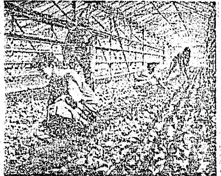
În serele Stațiunii de producție și cercetare legumicolă Aradul Nou se pregătesc răsădurile de varză.