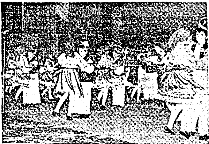
Ansamblul de cîntece și dansuri populare din Căpânaș.