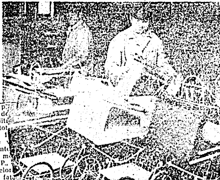
Aspect de muncă la Întreprinderea de bunuri metalice Arad.