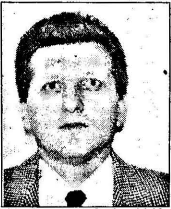
obiective care au dus la critici la adresa primarului?