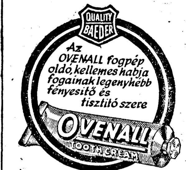
A HABZÓ FOGPÉP

Belgrádi politikai körökben épp úgy, mint Zágrábban is azt hiszik, hogy az általános mozgósítás kérdését vitatták meg. Jugoszláv mértékadó körökben hangsúlyozzák, hogy a Délkelet Európát érintő riasztó hírekkel szemben Jugoszlávia továbbra is nyugodt marad és elhatározott szándéka minden körülmények között megőrizni semlegességét.