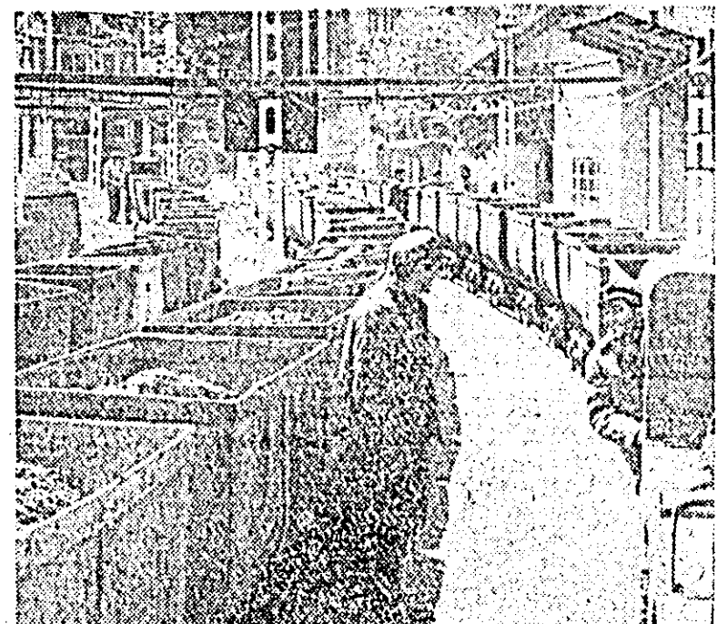
Instantaneu din Vașcău. De aici pornește minereul de fier la combinatul din Reșița.