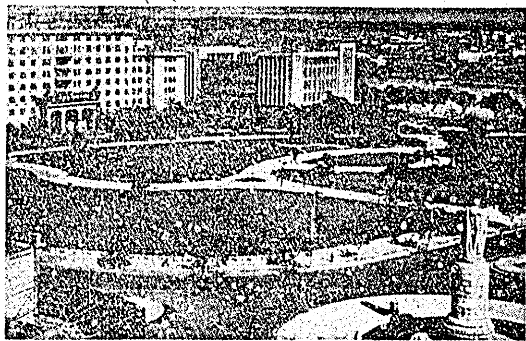
Vedere panoramică a Cantonului din R. P. Chineză.

★ Poziția adoptată de Partidul Social-Democrat din Germania față de războiul din Vietnam a provocat încordarea relațiilor sale cu partenerul de coaliție guvernamentală, Uniunea Creștin-Democrată relatează agenția France Presse. Purtătorul de cuvînt al UCD, Arthur Rathke, a reacționat prompt față de această poziție.