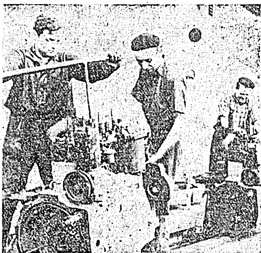
Uzina de reparații. Aspect de muncă la banda de reparații a motoarelor de tractor.