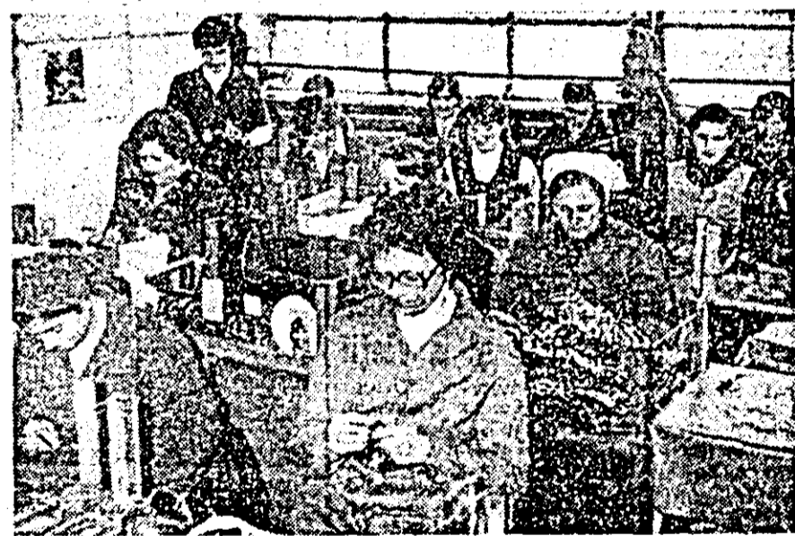
Secvență de muncă din atelierul de asamblare a ochelarilor metalici de la întreprinderea de bunuri metalice.