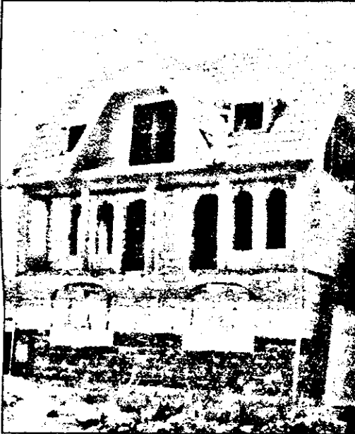
În orașul Nădlac s-au eliberat zeci de autorizații pentru construcții de locuințe. Se construiește deci mult, dar și frumos, opinăm noi.

Ca peste tot, nici la Nădlac nu s-au împărțit titlurile de proprietate. S-au primit în jur de 1700 și actualmente se lucrează la fișele premergătoare acestora. În total, se vor împărți un număr de 4200 de titluri.