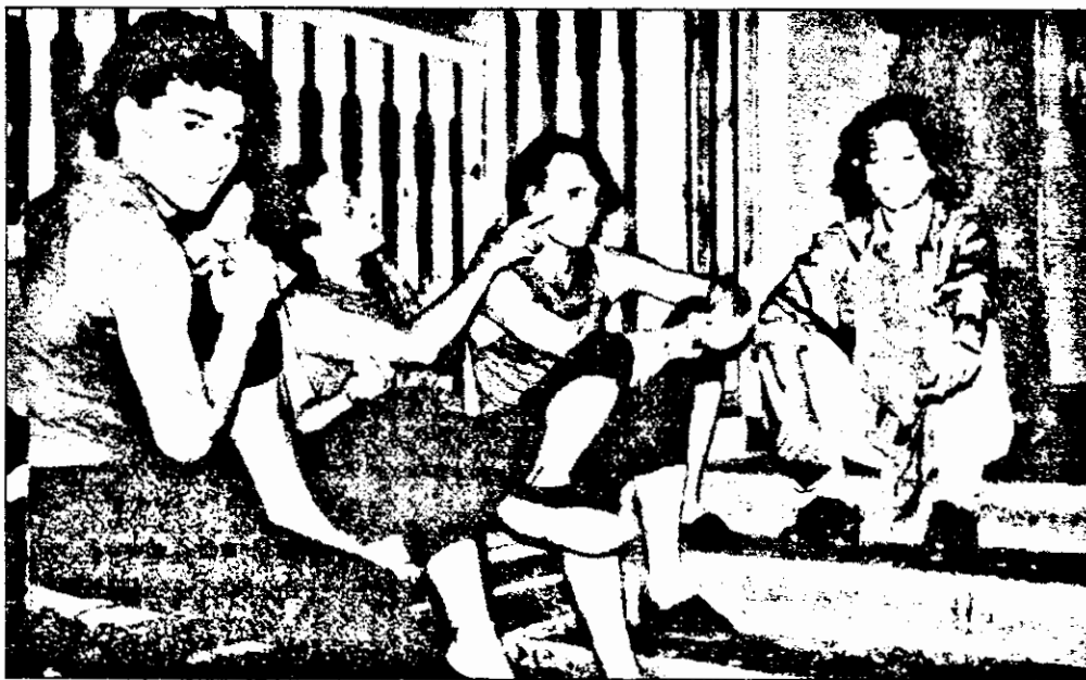
Emoții „artistice” înainte audierii concurenților de către Andrei Șerban.