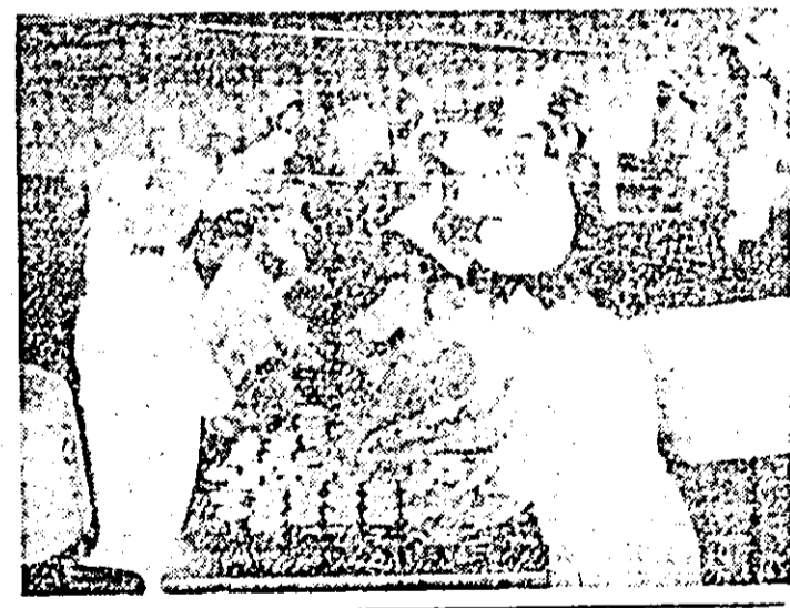
I.P.I.L.F. „Relacrea”. Se lucrează din plin la producerea conservelor din legume.

Se pare că pietele orașului sînt puncte de atracție și pentru unii șoferi care ar