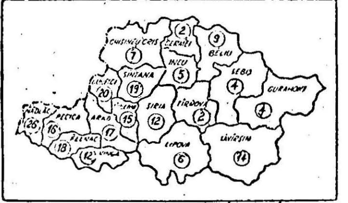
Stadiul însămînțării porumbului în consiliile unice agro-industriale din județ pînă în ziua de 8 aprilie (în procente față de plan).