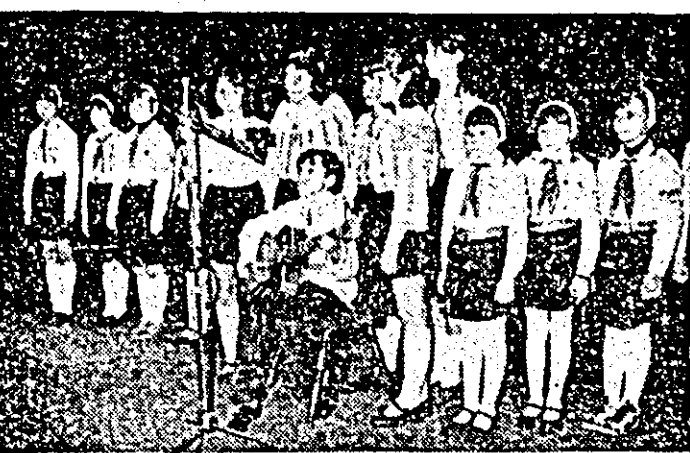
Montajul literar-muzical „Partid iubit, îți mulțumim” a fost prezentat de către pionierii școlilor generale nr. 5 Arad și a celor din Șiria la cinematograful „Dacia”.

La vîltoarea ședință a cenacului, de marți, 19 mai a.c., la ora 18, va citi proză scriitorul C. Marandiu.