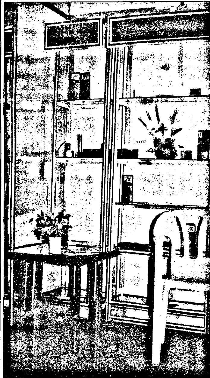
Mobilier modern, în aranjament modern.