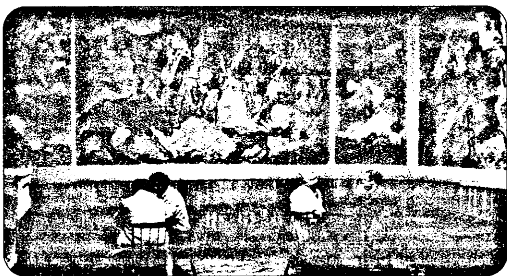
În timpul liber - și au destul - bolnavii psihici pictează, uneori cu talent.

tive. În aceste zile, o comisie din partea Direcției Sanitare Județene s-a deplasat la Bulci, întocmind și documentația privind inventarul „la zi” al clădirii, astfel că în perioada imediat următoare, în funcție de „finanțe” se va hotărî soarta ei. Nu ne rămâne decât să sperăm că, nu peste multă vreme, vom putea vizita la Bulci un spital și nu o ruină.