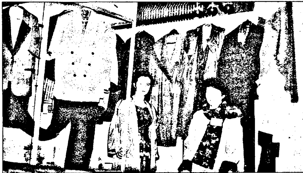
Nu numai exponatele au aspect plăcut...