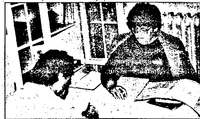
În principal, pentru diagnosticare se folosesc testele psihiatrice.