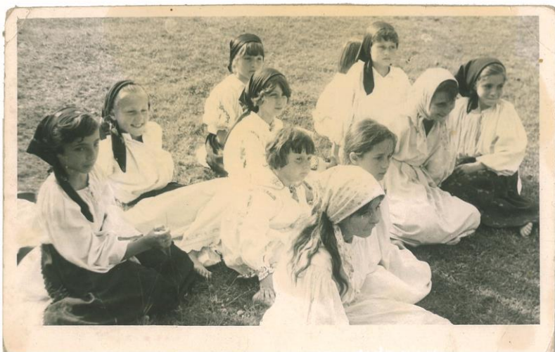
Fete așezate pe câmp, în port tradițional

În afară de muncile amintite și pentru a-și asigura pâinea necesară locuitorii își mai valorificau fructele pomilor prin satele de câmpie sau participau cu brațele la efectuarea muncilor agricole de la câmpie. Acest lucru se poate vedea și în filmul „Pădureanca”, adaptare după nuvela cu același titlu a lui Slavici. La acest film au participat și săteni din Zimbru, printre care m-am numărat și eu.