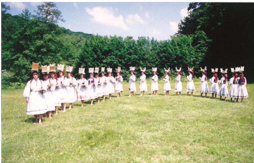
Fete în semicerc, pe scaun

Alături de alte obiceiuri care se mai păstrează în Zimbru, urmașii pădurenilor lui Slavici mai păstrează un obicei de primăvară: „ Albitul pânzelor la vale ”.