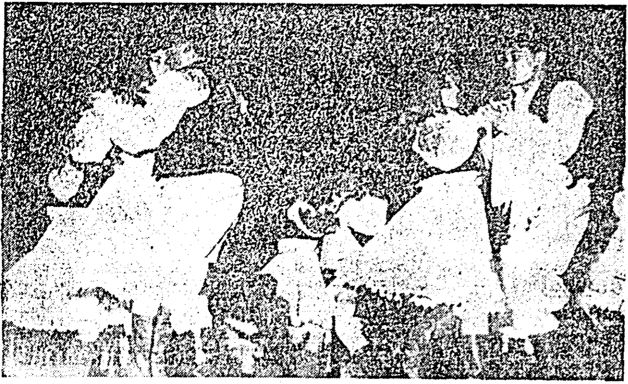
IN IMAGINE: echipa de dansuri populare a clubului „Teba”