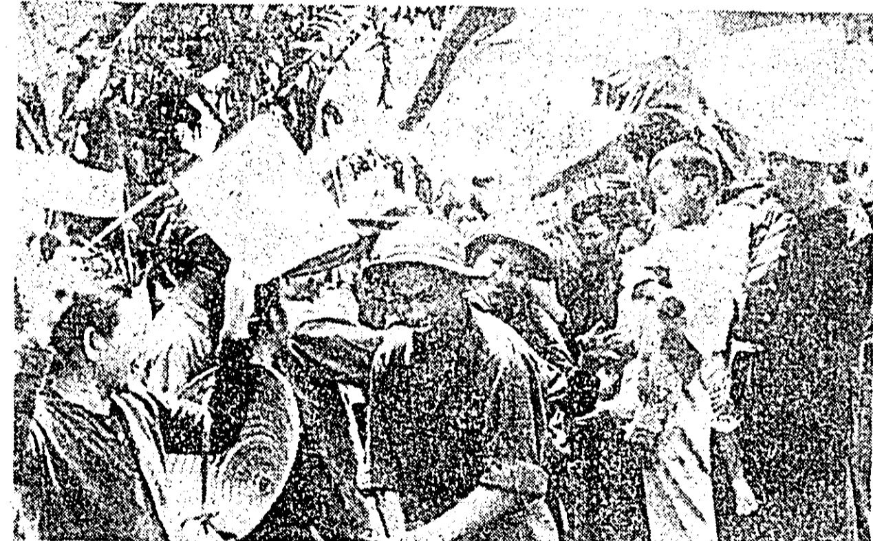
VIETNAMUL DE SUD. După lupte crâncene o parte a teritoriului Vietnamului de Sud a fost eliberat de către forțele patriotice. În FOTO: Populația din zonele eliberate Quang Tri-Thua, face o călduroasă primărie soldaților F.N.L. Parte din aceștia sînt soții și fiii lor.

Abolirea privilegiilor nobiliare pe întreg teritoriul Indiei degreveză bugetul central al țării și cel al statelor care compun federația indiană de cheltuieli apreciate anual la 6,4 milioane de dolari.