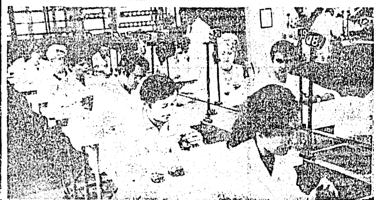
Sute și sute de ceasuri de bună calitate ies din miinile acestor harnici muncitori de la banda de montaj a fabricii „Victoria”.

La toate acestea s-au adăugat cheltuielile uriașe pentru pregătirea și desfășurarea războiului antisovietic, distrugerile provocate de