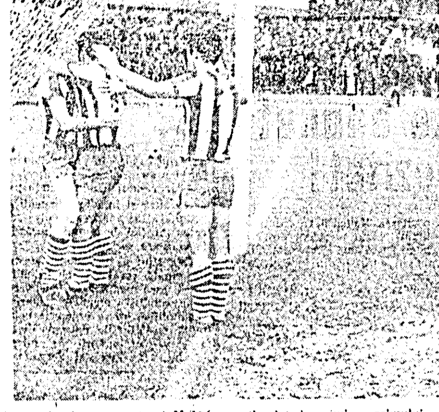
În timp ce portarul Mahtî pare izolat de primirea primului gol, jucătorii textulisti își manifestă bucuria. Fază din meciul UTA-Progresul.

VAGONUL: Weichelt — Lenarth, Bakos, Mülroth, Czako II — Kato (Schweinsinger), Boros, Seccanschi (Mertesz) — Alodiresel, Moț, Macavei. CFR: Wesser — Cotarcă, Bermozer, Alexandru, Ciociban — Gligor, Vlad, Beșuca, Gyenge, Damian, Kürsli. ST. I.