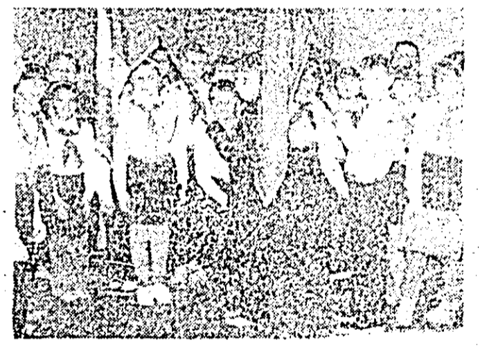
Pionierii detașamentului cl. a V-a B (Școala generală din Nădlac) au semnat Legământul pionieresc în cadrul unei frumoase festivități ce s-a desfășurat la locul de muncă al părinților — secția croitorie serie a C.P.A.D.M. Nădlac.