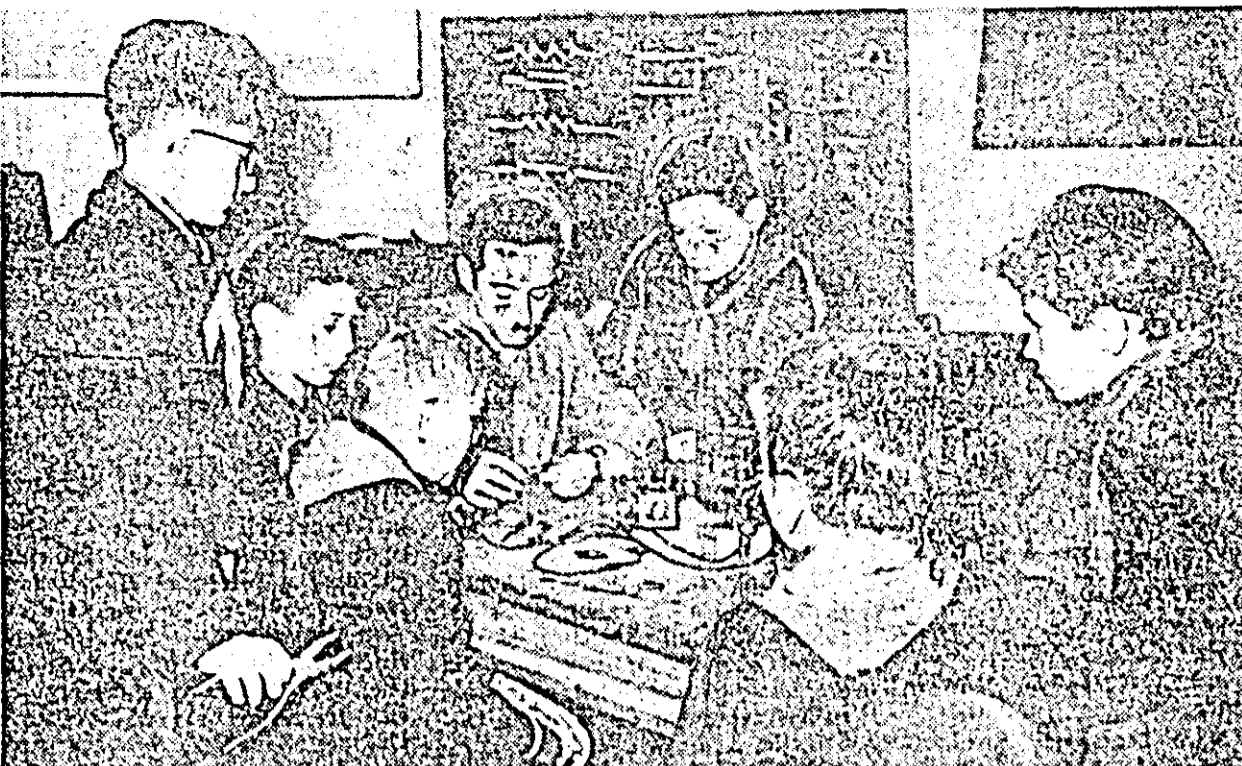
La Casa pionierilor din orașul Arad funcționează un număr mare de cercuri în cadrul cărora își desfășoară activitatea zeii de pionieri.