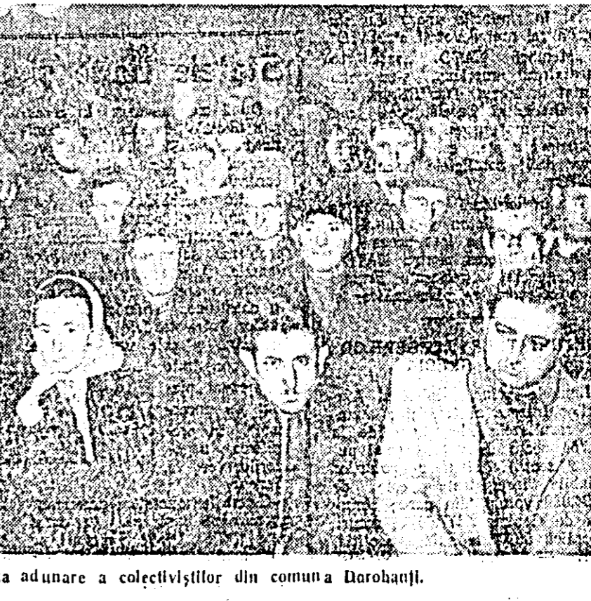
Un aspect de la recenta adunare a colectivității din comuna Darobanți.