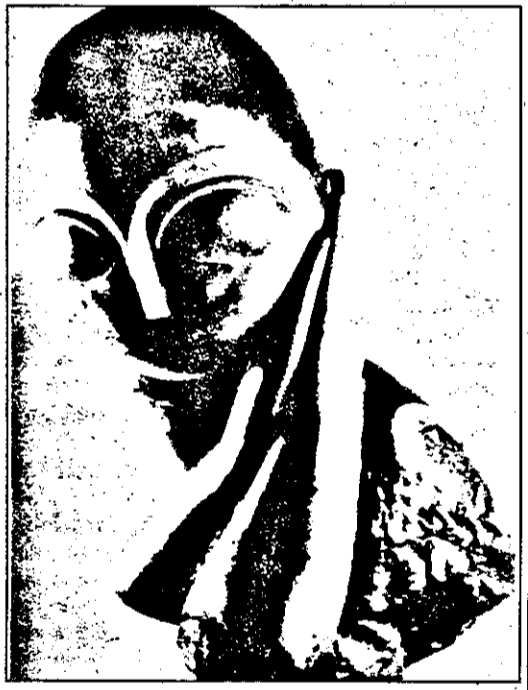
"Domnișoara Pogany" Bronz patinat, parțial colorat; zgâriat în spate, stânga jos: Brâncuși, Valsuani, 1913.

fiecărui donator va fi înscris în cartea cititorilor de la intrarea în Muzul Național de Artă. B.D.