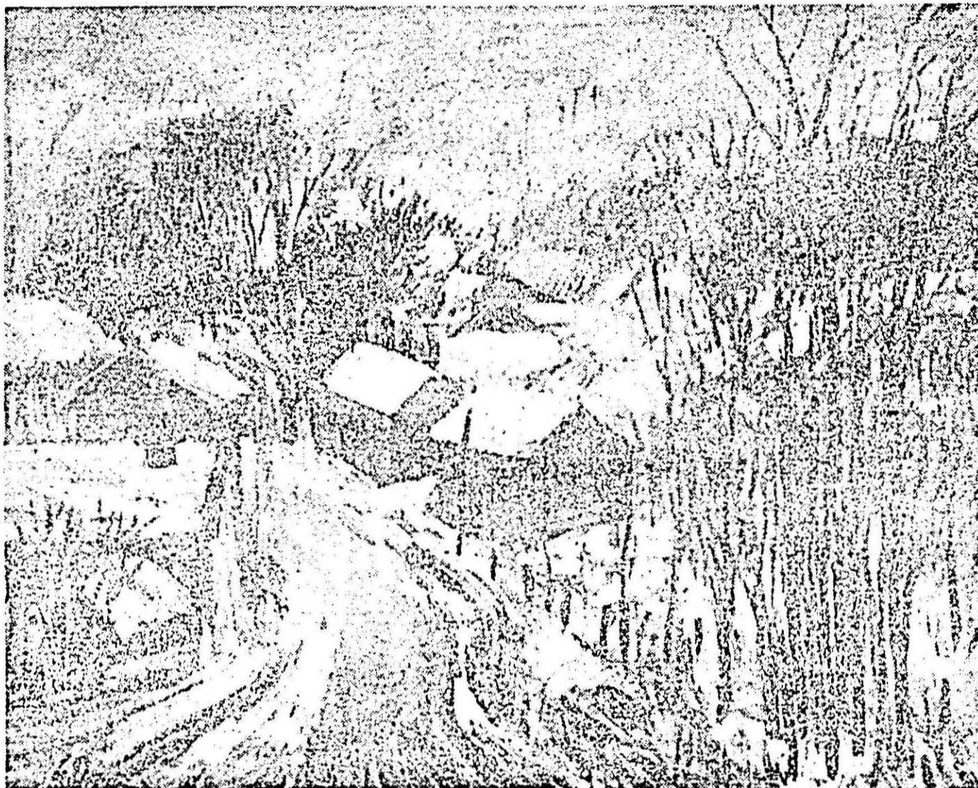
„Iarnă la Săvișin”