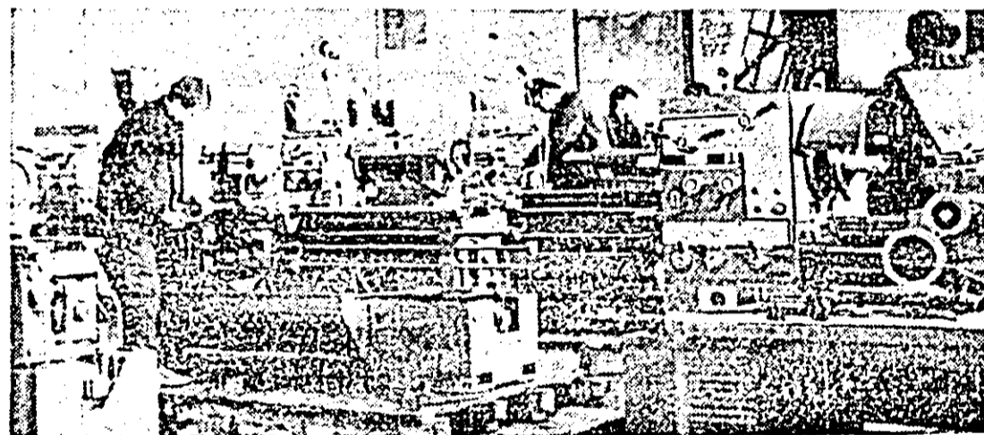
Întreprinderea de mașini-unelte. În atelierul finisaj-recepție un nou lot de strunguri este pregătit pentru export.