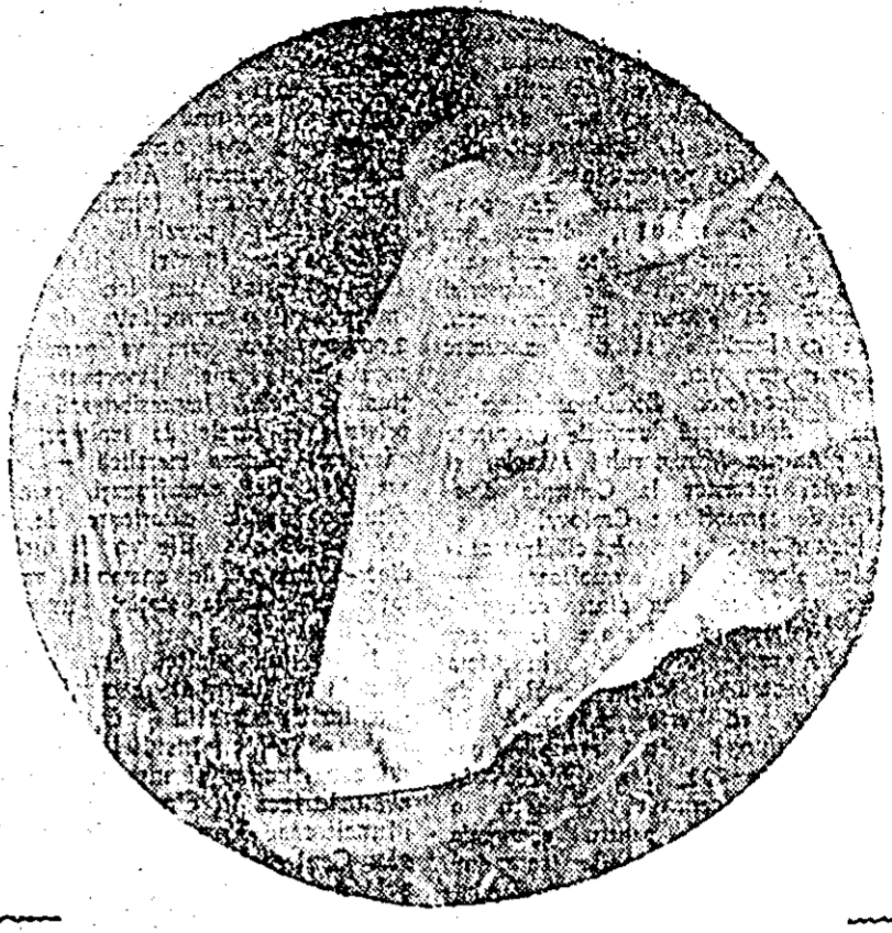
În anul acesta, la gospodăria agricolă colectivă „Lumea nouă” s-au construit mai multe grajduri pentru adăpostirea animalelor. În aceste grajduri, după cum se poate vedea și din clișeu de mai sus, s-au introdus adaptoarele automate, fapt care ușurează munca îngrijitorilor și asigură adăparea la timp a vacilor.

iar altele, ca de pildă cocii de potumb, se depozitează în prezența amenajărilor de furaj. S-au amenajat depozite de furaj, au fost îngrădite locurile unde au fost depozitate furajele. Această măsură este foarte bună, evitînd risipa și consumul nerațional al acestor furaj. Pentru prepararea furajelor grosiere, fermele zootehnice au cumpărat tractoare și toacătoare cu care zilnic se vor toca paie și tulpini, care după tratare cu var sau melasă și utec sintetică, vor fi date în hrana bovinelor puse la îngrășat. Morile cu ciocane pentru prepararea urmelilor au fost deja reparate, dotate cu personal corespunzător, astfel ca în timpul iernii să poată funcționa în bune condiții. Pentru evitarea unor epizote au fost executate controale sanitare veterinare pentru depistarea și izolarea animalelor suspecte. Vaccinările în mare parte au fost executate la fiecare animal, iar contra altor boli sînt în curs de efectuare, după planul de vaccinare stabilit.