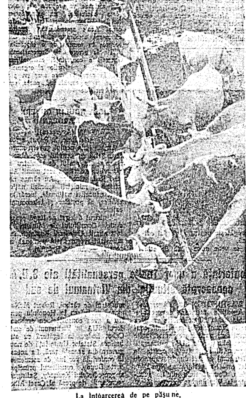
La întoarcerea de pe pășune.

Creșterea producției animale sînt permanent în centrul preocupărilor consiliilor de conducere ale celor două gospodării agricole colective la Curtea de Ardeș. În acest scop au fost luate măsuri corespunzătoare, printre care și asigurarea cu furaj. Astfel, la gospodăria colectivă „23 August” pentru perioada de stabulație la grajd a bovinelor s-au pregătit și depozitat în bune condiții furaje concentrate, 200 tone fin de lucernă și țărăbă de Sudan, s-au însușițat 1.180 tone de potumb și 200 tone de secară în amestec cu borșoag, iar pentru vite s-au pregătit și 10 tone de mazăre furajeră. Pentru o mai bună îngrijire și furajare mai rațională, vacile au fost țoțizate pe timp de iarnă.