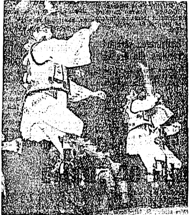
Dans lecleresc de pe Someș