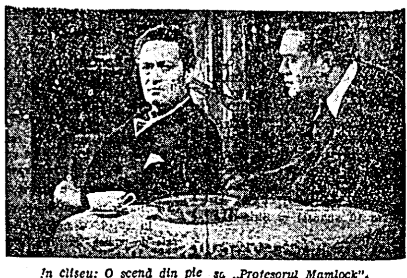
În cînteu: O scenă din piesa „Profesorul Mamlock”

seculesc de stat din Tg. Mureș va mai prezenta cîteva spectacole cu piesele „Profesorul Mamlock” și „Zlariștii”. Spectacolele vor fi prezentate în sala Teatrului de stat din Arad.