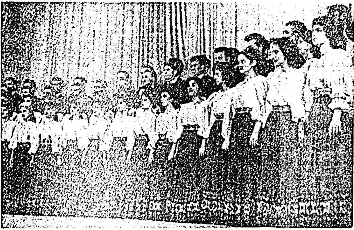
Corul ansamblului C.C. al U.T.M., interpretând un cîntec.