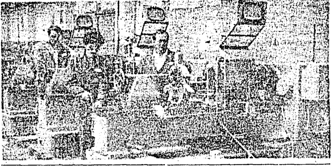
Aspect de muncă din secția montaj a întreprinderii de mașini-unelte.