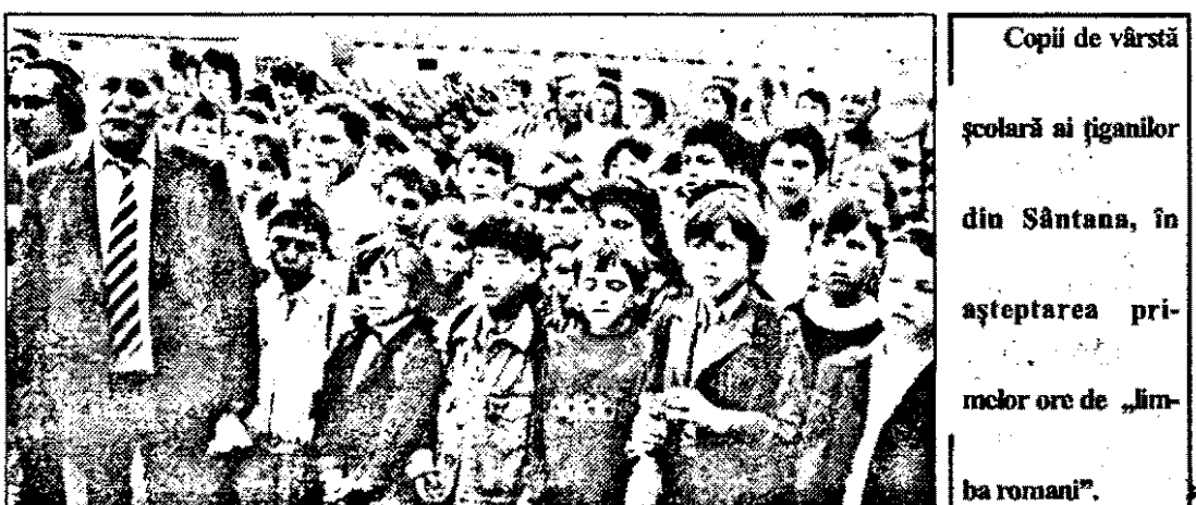
Copii de vârstă