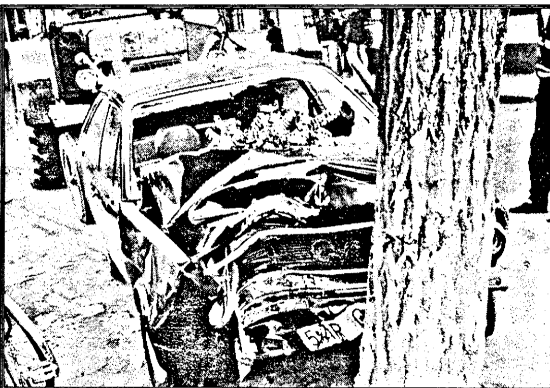
Și uite-așa un pom l-a leșt în față...

Păunescu a precizat: „Dacă este cineva în partid gata să renunțe la post, dacă interesele partidului o cer, acela sunt eu”. Senatorul PSM a refuzat să confirme sau să infirme existența unei lupte pentru putere în PSM, iar despre relațiile sale cu Tudor Mohora, a afirmat că „sunt excelente”, cu următoarea mențiune: „Tudor Mohora este vicepreședinte, ceea ce este enorm, iar eu sunt prim-vicepreședintele, ceea ce este mai mult”.