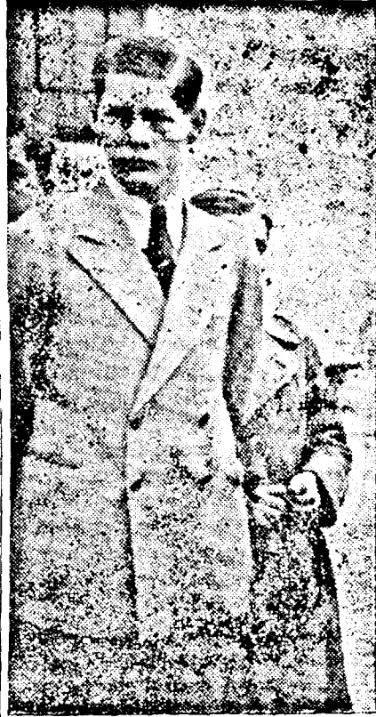
Măria Sa Marele Voevod Mihai de Alba Iulia