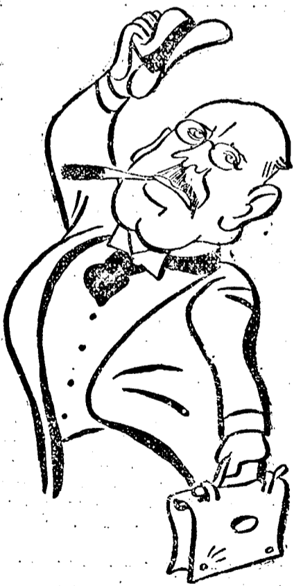
AVENOL, a Népszövetség főtítkára.

A népszövetségi tanács délutáni nyílt ülésén Aloisi olasz fődélegátus több ízben fel-