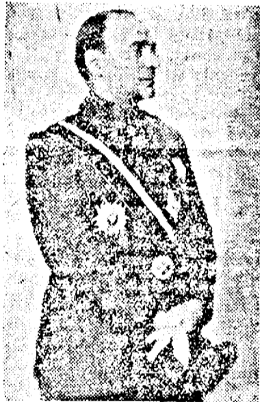
D. primministru Armand Călinescu

Grija deosebită pentru armată, atât în ce privește necesitatea de asigurare a celei mai bune pregătiri și înzestrări, cât și ameliorarea condițiilor de existență a trupei și corpului ofiteresc, a caracterizat politica noastră de stat cu deosebire în ultimul an, sub noul regim de guvernare.