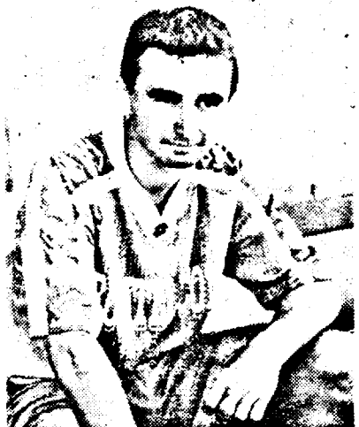
Corinda a transformat penalty-ul prin care Telecomul deschidea scorul în fața Corvinului

La Hunedoara, Telecom a hotărât poate viitoarea promovată a seriei a VI-a, obligând Corvinul să se mulțumească doar cu un rezultat de egalitate.