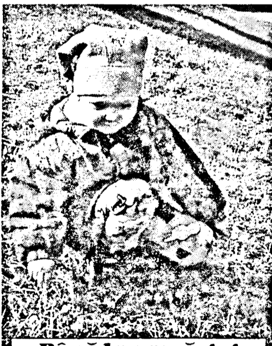
Până la urmă, tot dau eu peste iepuraș