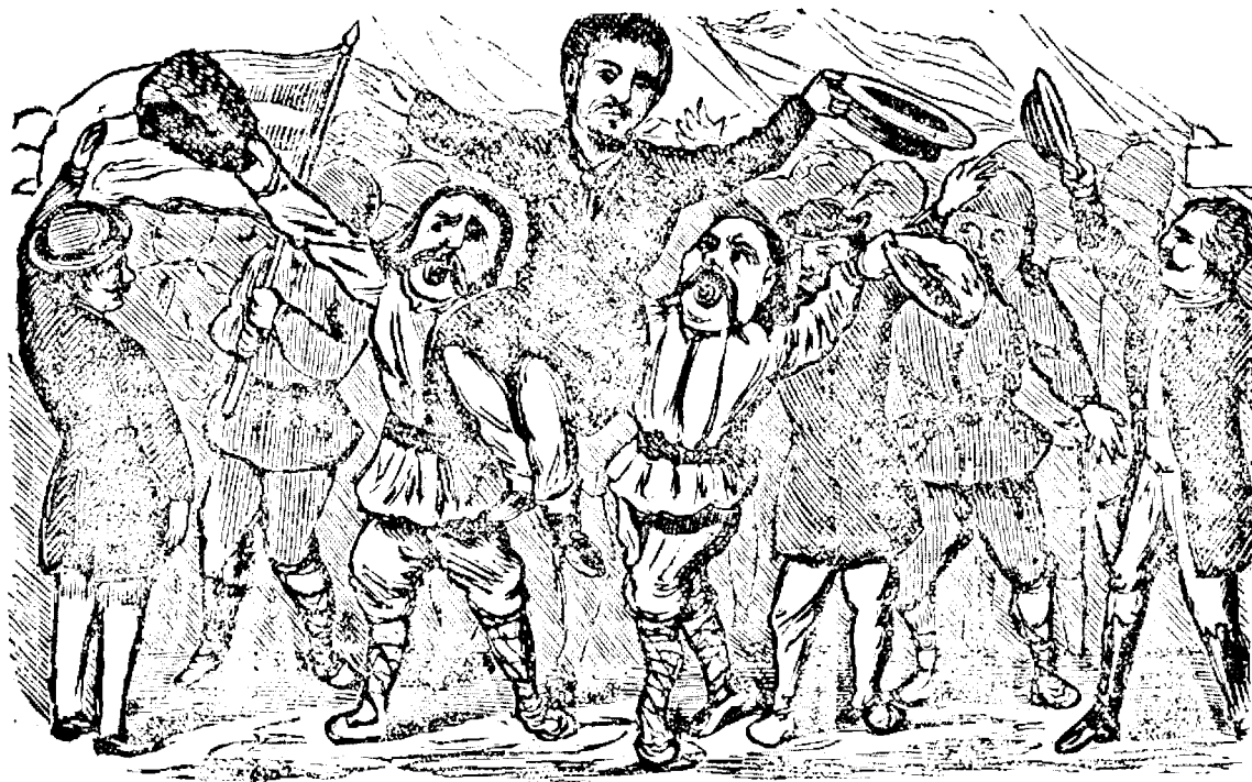
Un'a la Chisimieu.