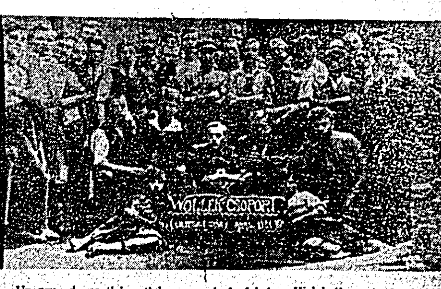
Un grup de participanți la greva de la fabrica Wolei-Csoport, Arad 1921