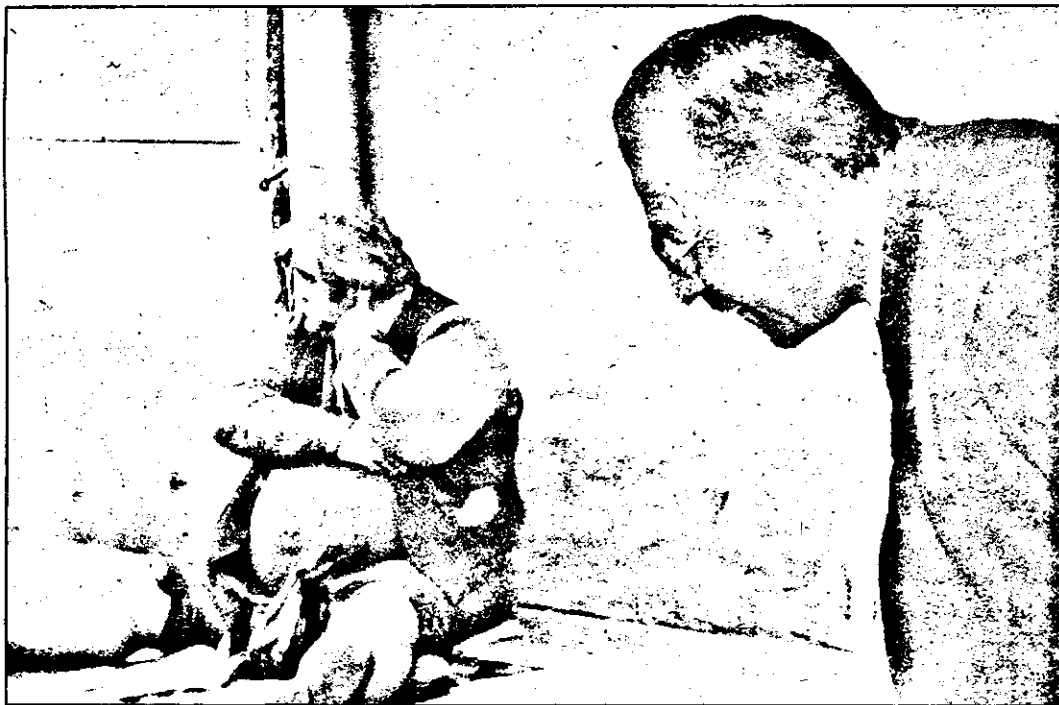
Președintele țării întrebă:

Totodată, domnia sa și-a exprimat nedumerirea „față de politica planificatorilor NATO de a înarma aberant Turcia și Grecia în ideea că, astfel, vor putea sprijini menținerea păcii în Balcani.”