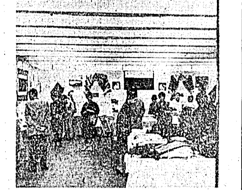
De un deosebit interes s-au bucurat numeroasele exponate prezentate la Expoziția de artă populară romînească organizată recent în orașul japonez Sapporo, din Insula Hokkaido.

NEW YORK 4 (Agerpres). Cotidianul „Film Daily” a organizat de curînd o anchetă cu scopul desemnării celui mai bun interpret, celui mai bune regii și celui mai bun scenariu de film pentru anul 1964. Au fost solicitați să răspundă peste 200 de critici de cinema din numeroase localități din SUA. La sfîrșitul sondajului a fost întocmit următorul clasament: Cel mai bun actor: Rex Harrison, Peter O'Toole, Peter Sellers, Richard Burton. Cea mai bună actriță: Julie Andrews, Sophia Loren, Audrey Hepburn și Ava Gardner. Cea mai bună regie: Stanley Kubrick, Tony Richardson, George Cukor, Peter Glenville și John Huston. Cel mai bun scenariu: Dr. Strangelove, My Fair Lady, Tom Jones, Molly Brown.