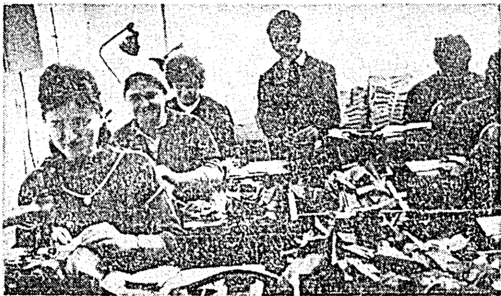
Un mic dar harnic colectiv din secția rîchitului a fabricii „Libertatea”. Aici se lucrează cu mașini moderne, care asigură o calitate superioară a produselor.

roră se analizează deficiențele existente la locul lor de muncă, se caută și se aplică metoda cea mai corespunzătoare pentru înlăturarea lor. La consfătuire se invită și muncitorii - fruntași, membrii de partid, maistrul secției etc. Acest procedeu se dovedește a fi folositor. De exemplu, în ziua de 26 ianuarie grupa de partid din atelierul pregătît-cusut schimbul A a organizat o asemenea consfătuire. A reieșit că la branțul și piciorușele sandalelor pentru femei, cusăturile nu corespund calitativ. A fost găsită cauza, iar conducătorului atelierului i s-a propus ca măsuri să ia. Astfel defecțiunea a putut fi înlăturată. La fel s-a întîmplat și în alt caz: pe partea interioară a fețelor nu se făceau semnele prin care montatorii să poată deosebi partea dreaptă de cea stîngă, la același picior. Vina era a tovarășilor din secția croi. Aducîndu-li-se la cunoștință faptul, li s-a propus să facă semnele respective. De atunci s-a terminat și cu acest neccaz. Urmarea prac-