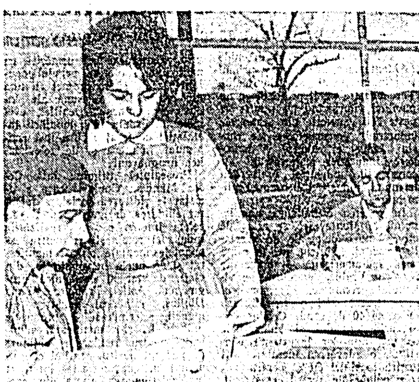
Printre muncitorii Fabricii de mobilă se găesc mulți cărora le este dragă cartea, de aceea ei își petrec timpul liber în biblioteca fabricii, studiînd diferite cărți.

GH. BURDAN, membru în comitetul U.T.M. de la Uzinele de vagoane