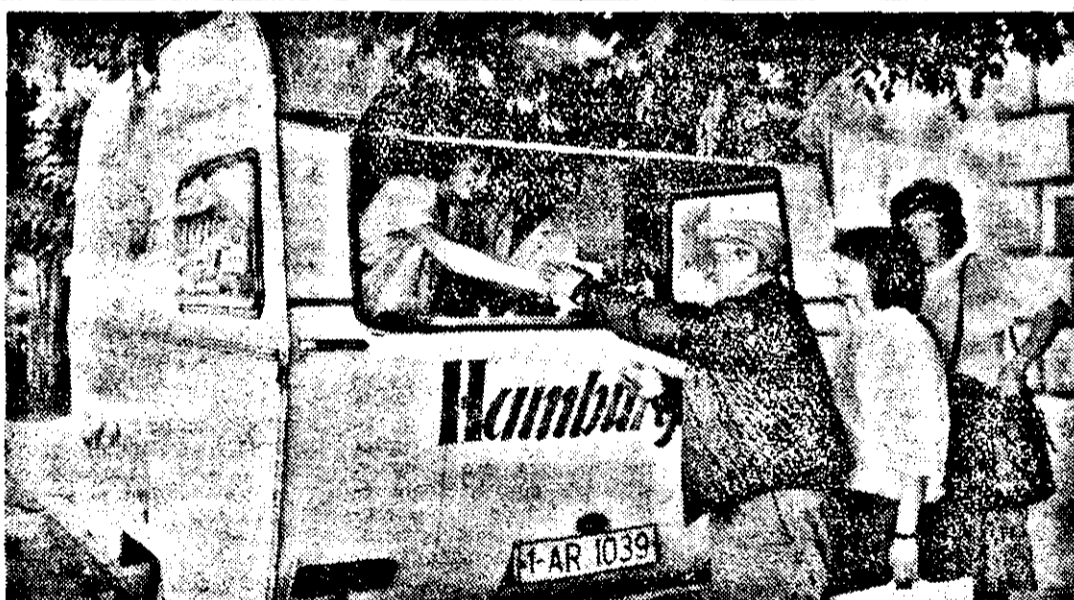
Inițiativa particulară în acțiune. Hamburger „à la Julieta” — la o tonetă din piața Filimon Sirbu.