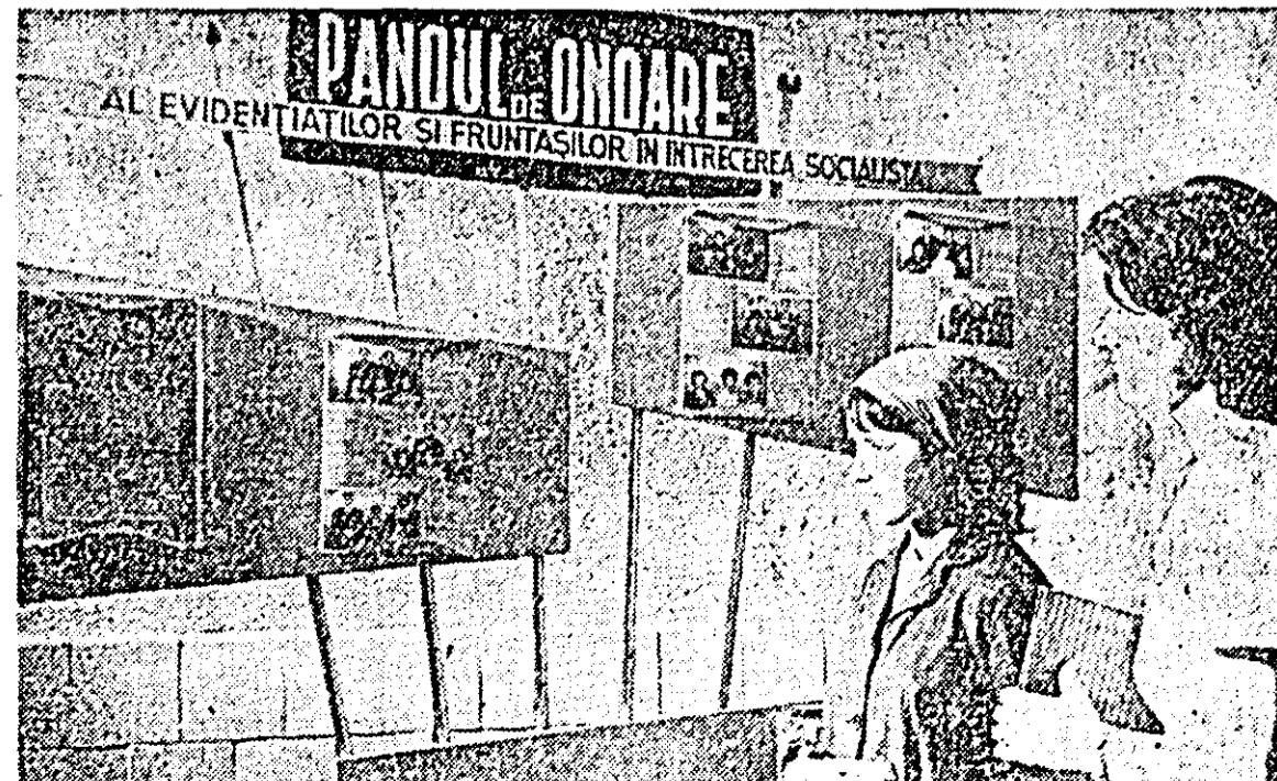
Pentru harnicele țesătoare de la Uzinele textile „30 Decembrie” panoul de onoare este un puternic stimulent spre rezultate tot mai bune în muncă.