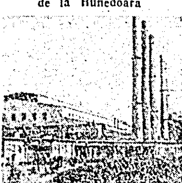
Noua oțelărie de la Hunedoara