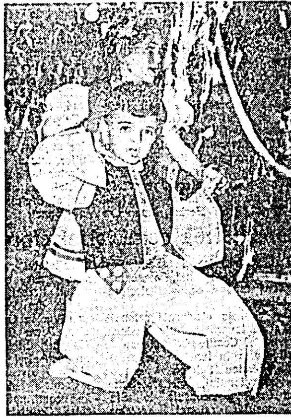
La sărbătoarea pomului de Iarnă care a avut loc la clubul „30 Decembrie” Căminul de zi al uzinei a prezentat un bogat program artistic. Cîntecul nostru reprezintă pe doi dintre cel mai mici artiști amatori, interpretînd un dans popular.

Merită evidențiate în această privință formațiile de cor din Șiria, Covășin, Pincota, Curtici care au început repetițiile cu noile cîntece introduse în repertoriu, formația de dans și tarantula de la Fiscuț, echipele de teatru din Mîndruțoc, Curtici, Pîncota și altele.