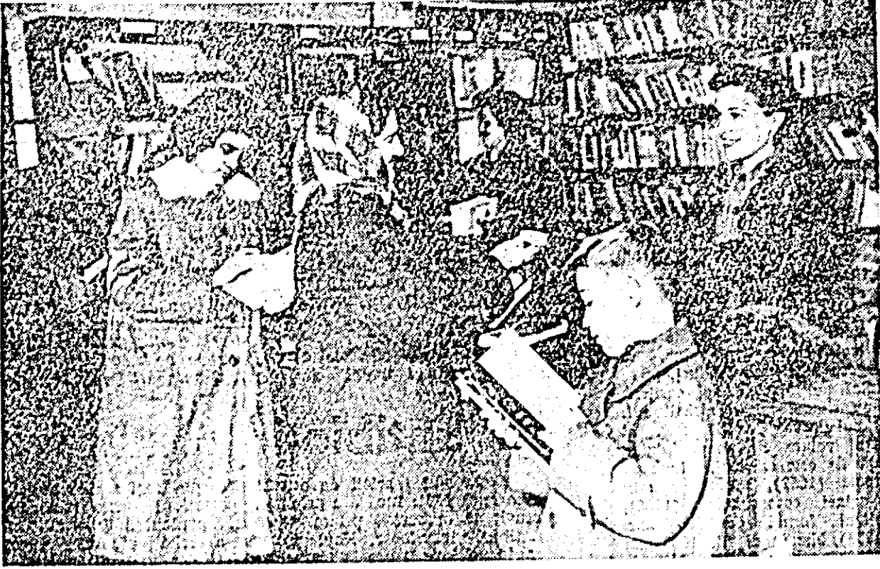
IN CLIȘEU: aspect din bibliotecă într-o zi de lucru obișnuită.