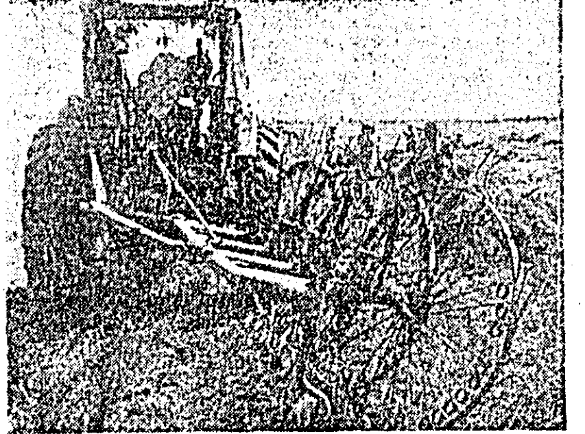
La ferma Hortia a I.A.S. Utvinș se lucrează de zor la adunatul lucernelor.