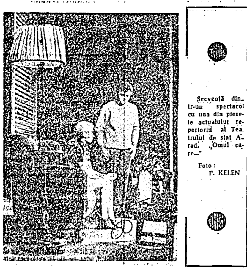
Secvență dintr-un spectacol cu una din piesele actualului repertoriu al Teatrului de stat Arad. „Omul care...”

Reputatul cor „Madrigal” al Conservatorului Ciprian Porumbescu din București s-a reînnoit recent dintr-un turneu în R. S. Cehoslovacă unde a participat la manifestările festivalului „Primăvara la Praga”. Astăzi, 27 mai, la ora 20 „Ma-