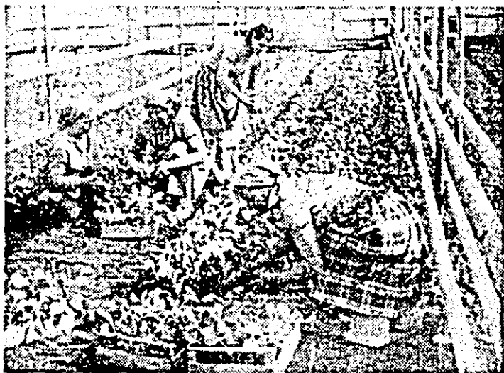
C.A.P. Sintana: răsădul de varză timpuriu este pregătît pentru plantarea în câmp.