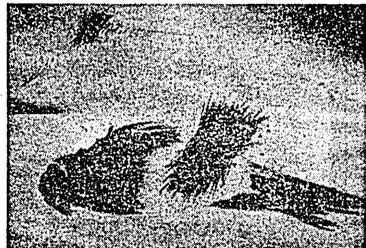
ONISIM COLTA: „Baladă I”.