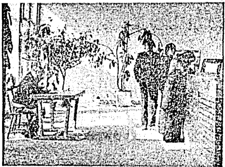
Aspect interior de la Oficiul P.T.T. din Calea Aurel Vlaicu.