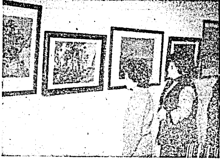
Sălile muzeului din Lipova găzduiesc o interesantă expoziție cu reproduceri din pictura lui Van Gogh. În fotografie: aspect din expoziție.