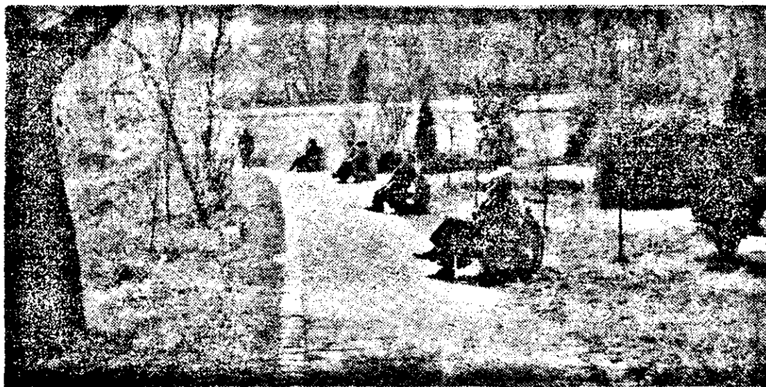
Zile însorite de primăvară.