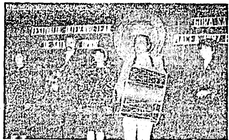
Brigada artistică a căminului cultural din comuna Bieleș, județul Mehedinți.