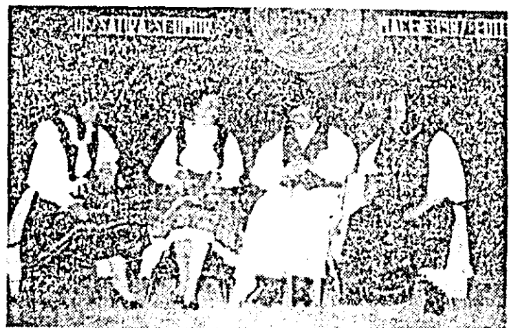
Formația de teatru nescris din comuna Holod, județul Bihor.