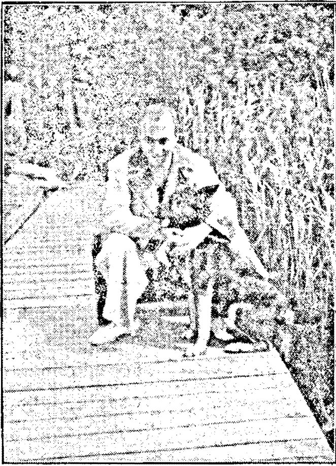
Artistul KARL RADDATZ, eroul a numeroase filme de mare succes.