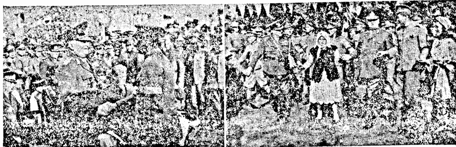
— „Hai să dăm mâna cu răzără. Cei cu inima română“.