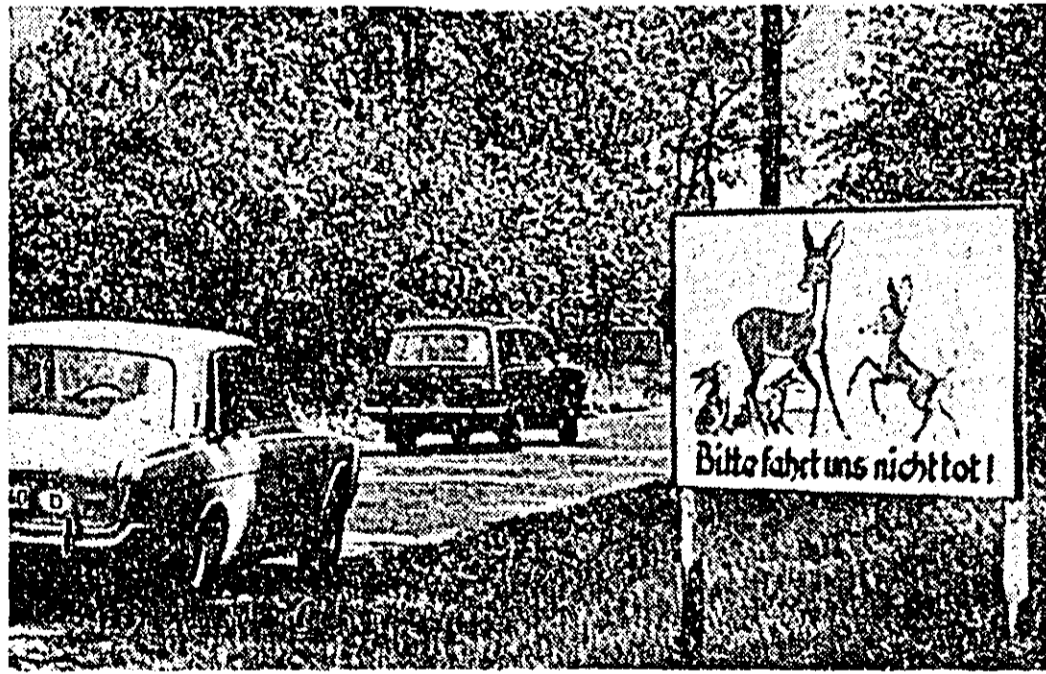
Pentru a apăra cerbii și căprioarele de accidente, respectiv de a fi lovite de turismele care le surprind pe șoseaua de la Hamelsee, lângă Eystrup, în nordul Germaniei, au fost așezate pancarte mari care atrag atenția automobilistilor asupra acestui pericol. Anul trecut s-au semnalat peste 300.000 accidente de acest gen. IN FOTOGRAFIE: vedere a șoselei și pădurii Hamelsee.