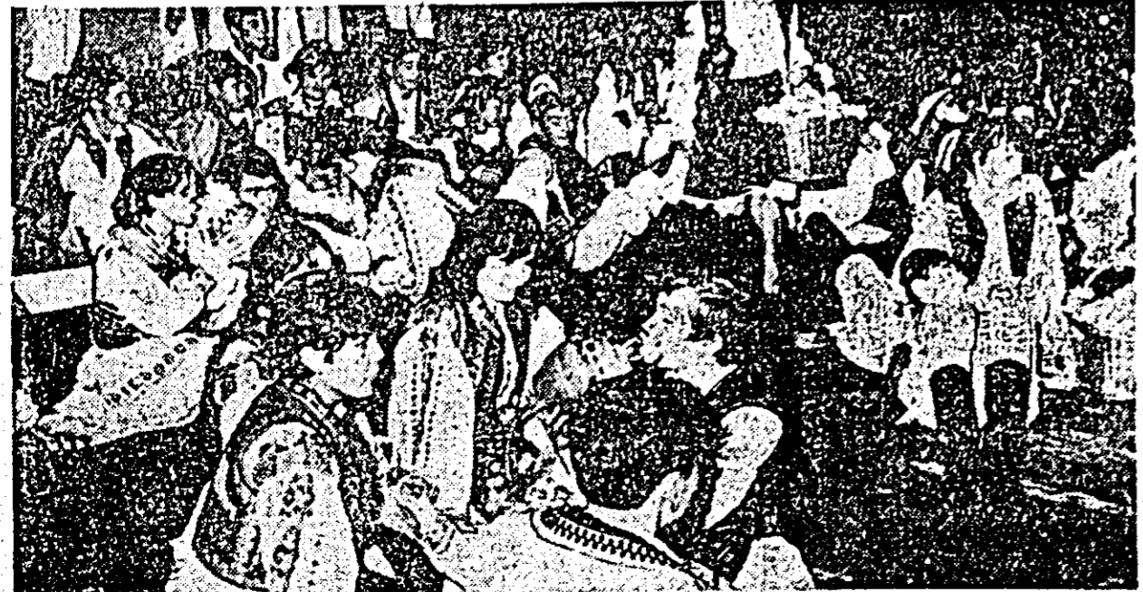
Ansamblul folcloric al Clubului tineretului din Oradea — „Li oara”.