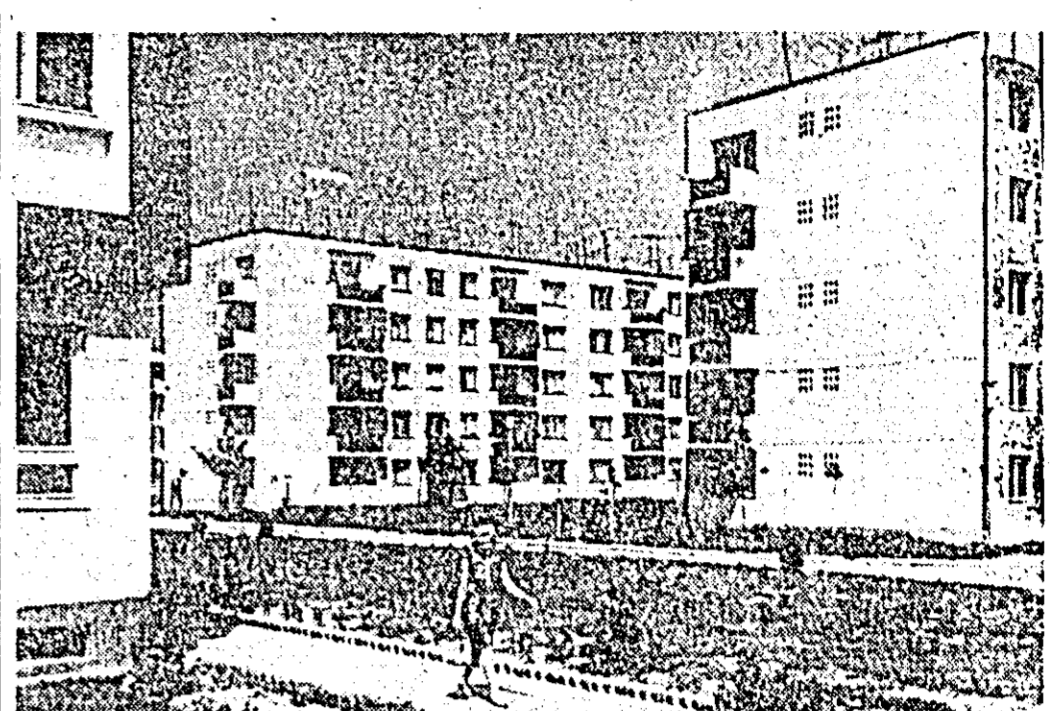
Asemenea tuturor orașelor patriei, înoul nostru treptel înnoirii. IN CLISEU noul cartier de locuințe.