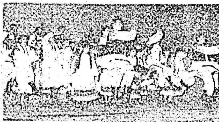
Formația de dansuri populare a Clubului tineretului pe scena galei laureatilor.