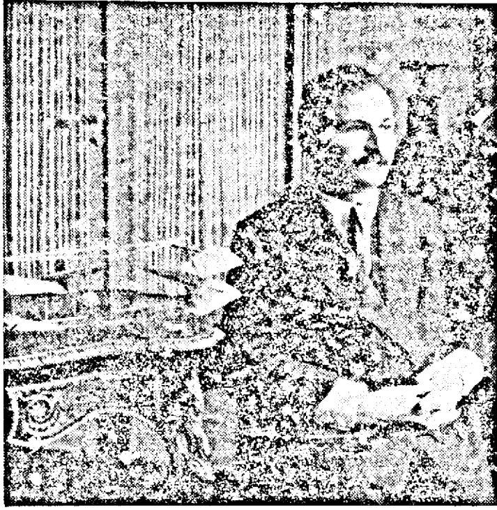
D. Traian Vuia în salonul său dela Garches