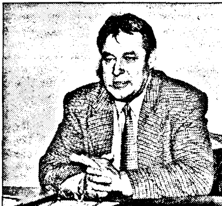
public nu este remunerat.

Conform legii, funcționarul public, căruia i se aprobă suspendarea, are posibilitatea să solicite reangajarea pe același post într-o perioadă de patru ani, dar nu mai repede de șase luni de la data aprobării. În perioada în care este în vigoare suspendarea, funcționarul